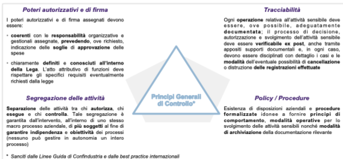
Fig. 3 – Vista sintetica dei Principi Generali di Controllo (esemplificativo)